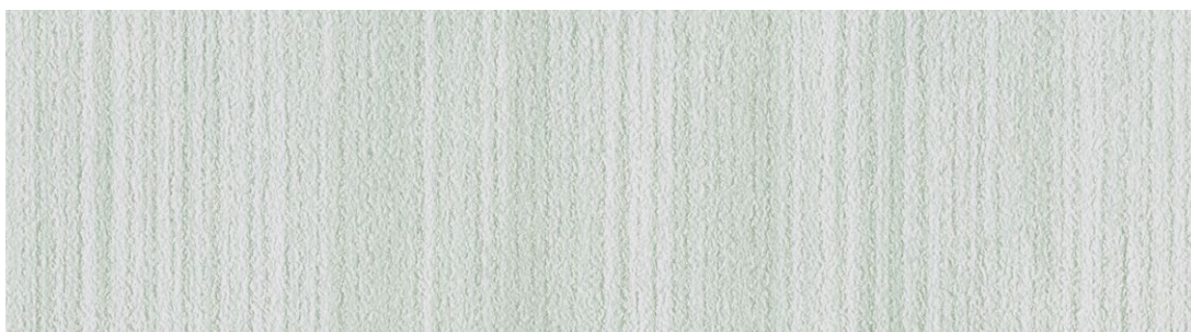
縞【Shima】no.331 色名：翠色(みどりいろ) 間中有効巾94cm 切売可