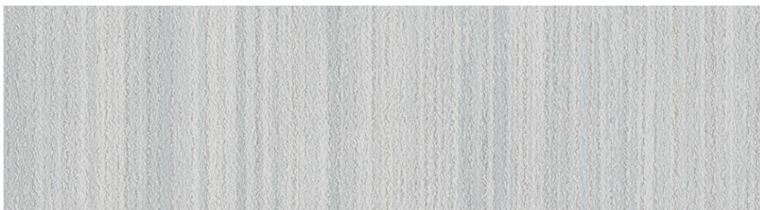
縞【Shima】no.333 色名：雪白色(せっぱくいろ) 間中有効巾94cm 切売可