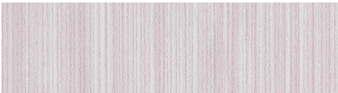
縞【Shima】no.330 色名：桃花色(ももいろ) 間中有効巾94cm 切売可