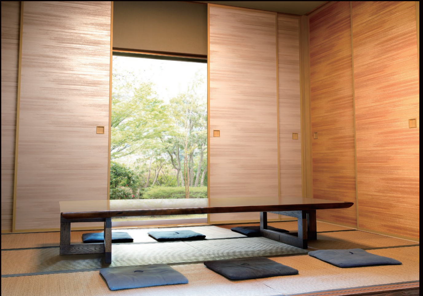
左: no.310 / 右: no.309