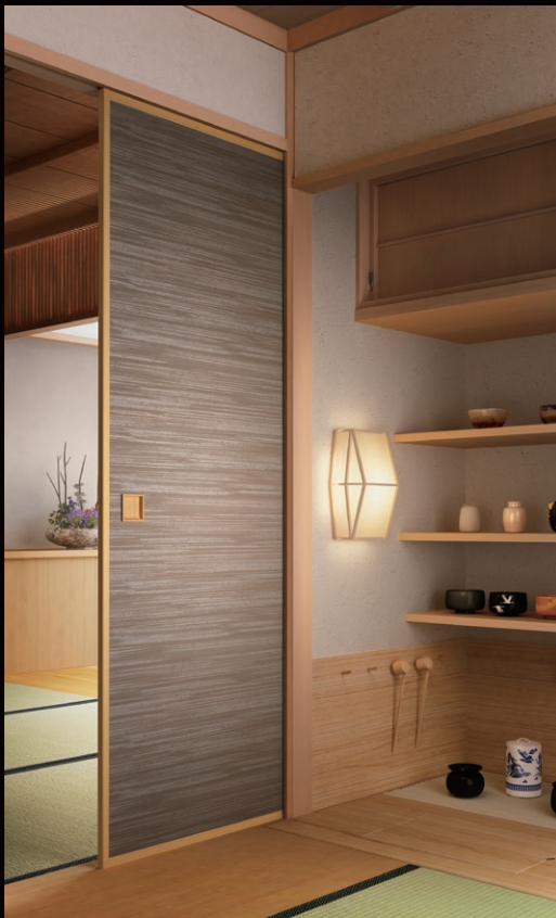
左: no.304 / 右: no.305