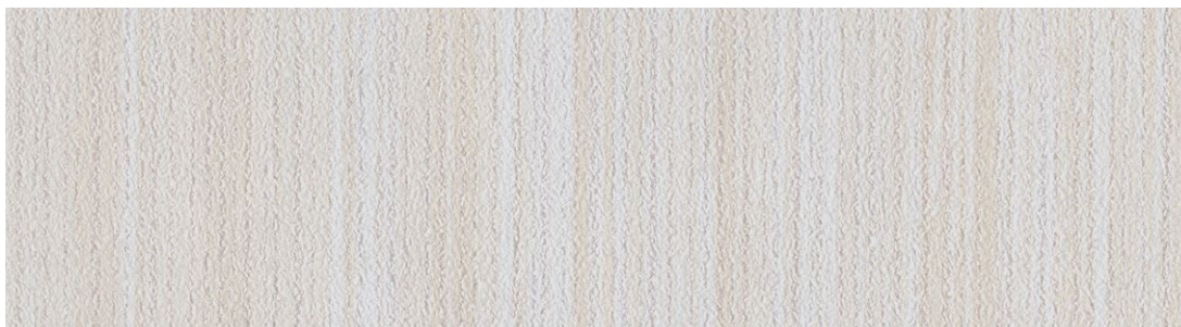
縞【Shima】no.332 色名：檸檬色(れもんいろ) 間中有効巾94cm 切売可