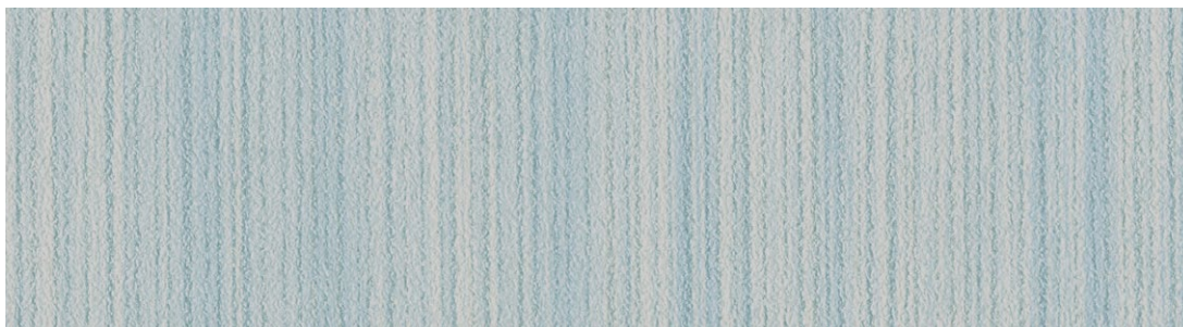
縞【Shima】no.329 色名：天色(そらいろ) 間中有効巾94cm 切売可